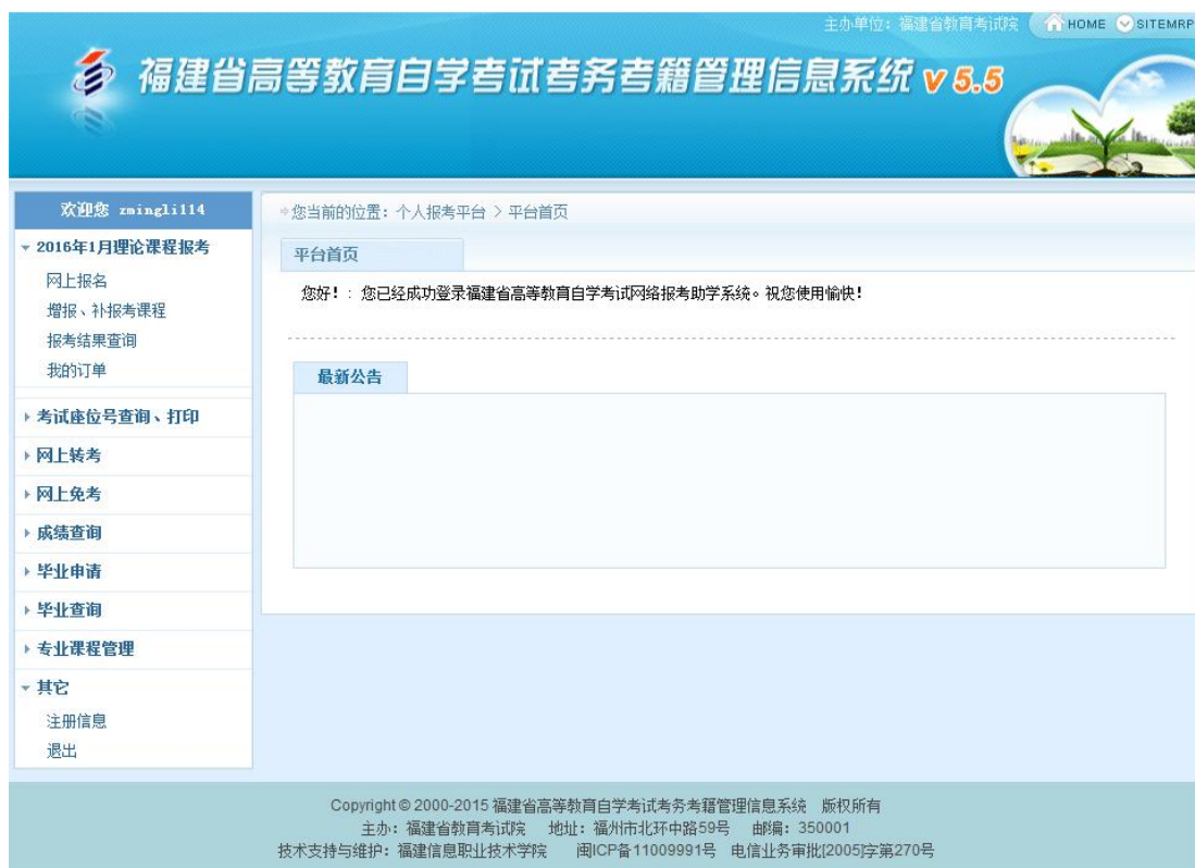
图 1.1 考生个人管理平台

1、考生登陆“福建省高等教育自学考试考务考籍管理系统”个人平台办理报名报考、网上转考、网上免考、成绩查询、省际转考等功能。